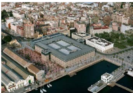
Sede del Congreso

La sede del congreso será la Facultad de Ciencias de la Empresa de la Universidad Politécnica de Cartagena (Calle Real, 3 - 30201 Cartagena, Murcia), donde se habilitará el Salón de Actos Isaac Peral, el Salón de Grados y distintos espacios para stands y exposiciones de las empresas