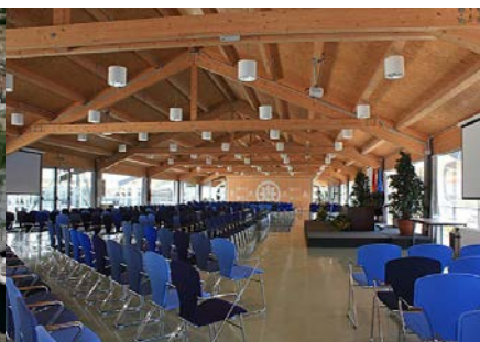
Salón de Actos Isaac Peral